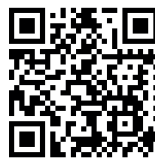
Online-Bewerbung Stadt Wien